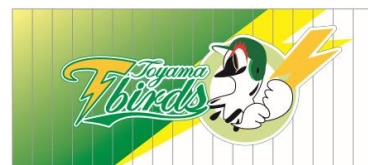
ハリセンイメージ

来場者全員に、オートバックスコラボハリセンをプレゼント！ スタンドからハリセンを叩いて選手たちを応援してください！ ※おひとり様1つとさせていただきます